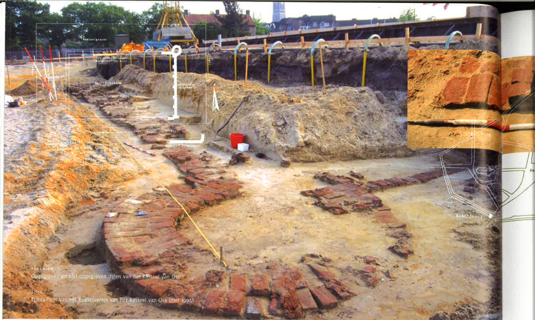
TEKENING Opgegraven en niet-opgegraven delen van het kasteel van Oss FOTO Fundament van het hoektorentje van het kasteel van Oss (mei 1994)