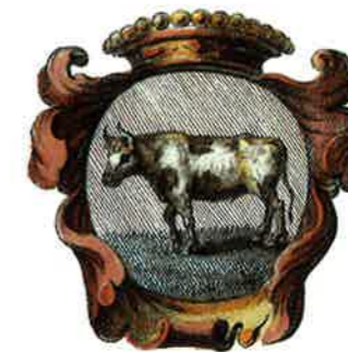
De os van Oss sierde het wapen van het kwartier Maasland

vóór 1233 Eindhoven, Helmond en Sint-Oedenrode van dorpen in stadjes.