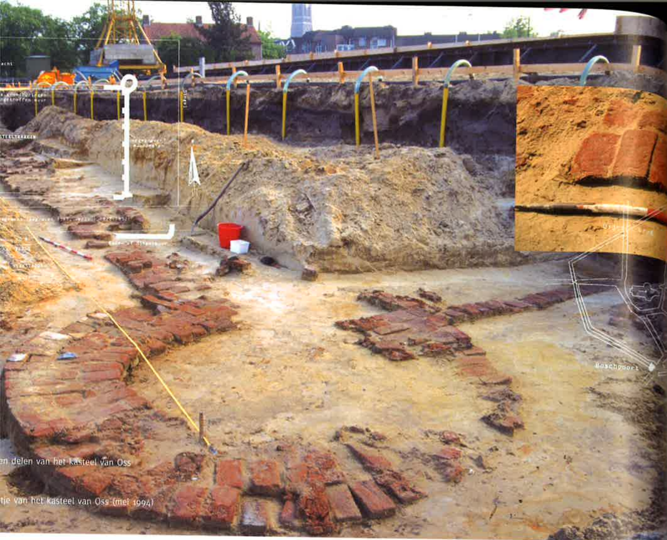
en delen van het kasteel van Oss tie van het kasteel van Oss (mei 1994)