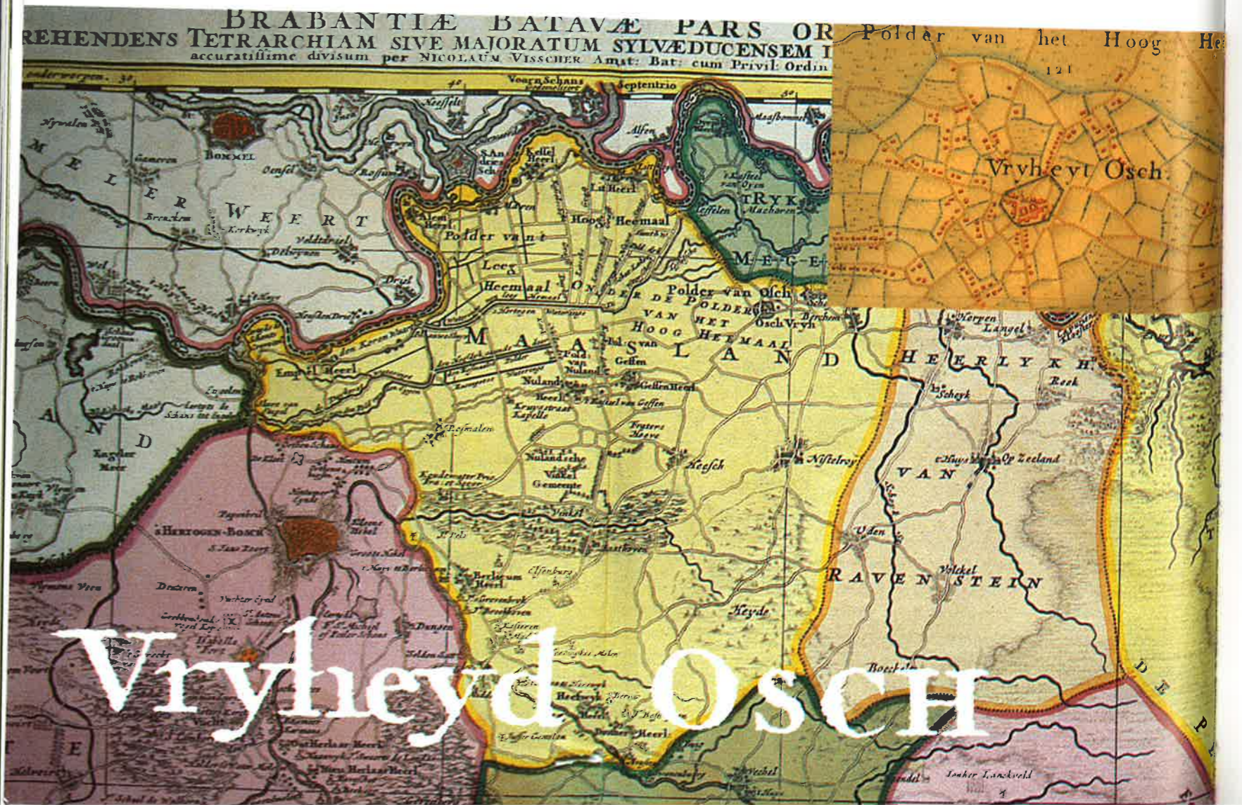
INZET De omgrachte vrijheid Oss in 1747